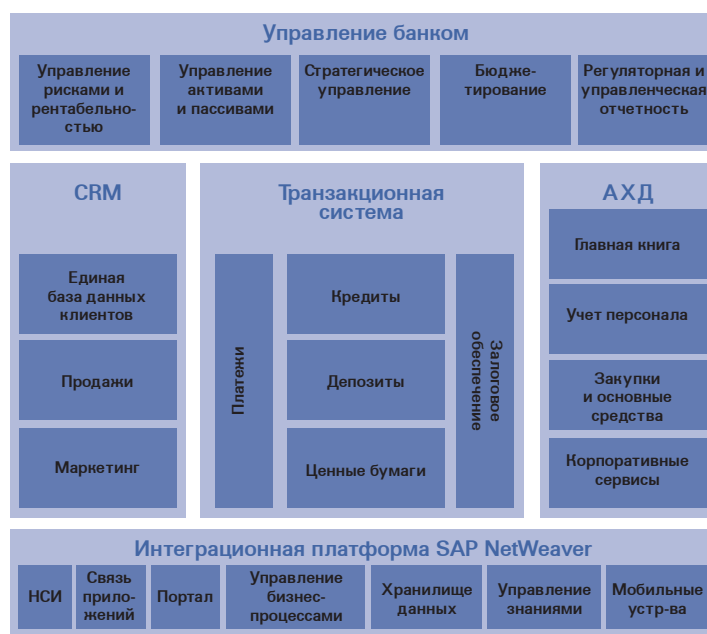
Рисунок 1. Архитектура решения SAP for Banking.

Функциональные возможности решения помогут построить комплексную эффективную систему управления банковским бизнесом и добиться бизнес-целей, поставленных как перед банком в целом, так и перед отдельными его подразделениями. Это целиком и полностью относится как к операционной деятельности, включая выполнение и анализ банковских операций, так и к организации работы с клиентами на протяжении всего цикла их взаимоотношений с банком.