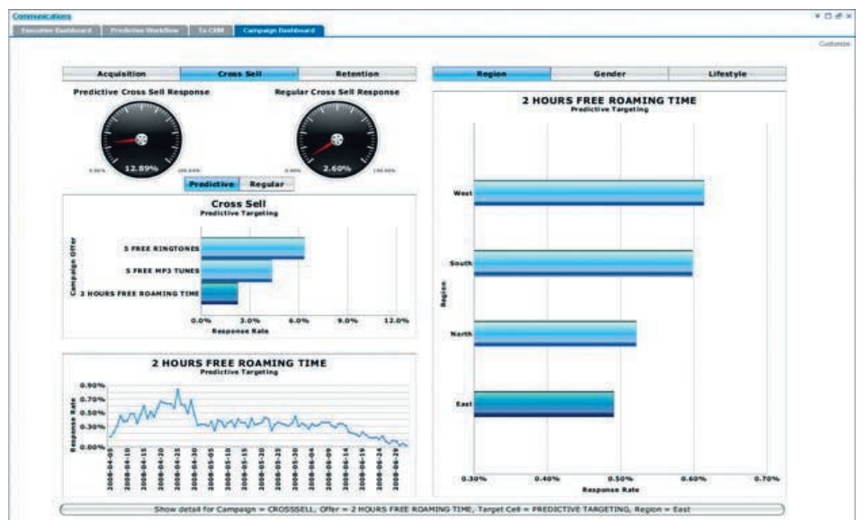
Рисунок 3. Пример аналитической панели Xcelsius.